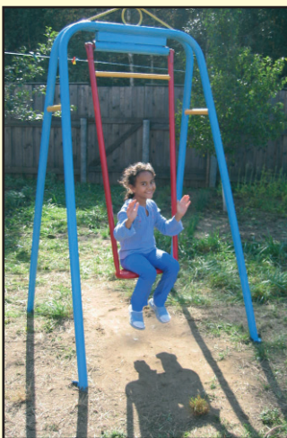
Mission Possible Moskou